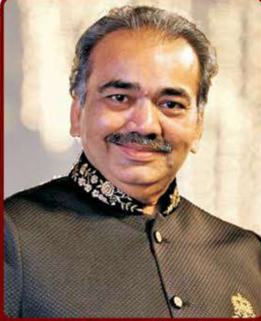
યક્ષુદાન કરેલ છે.